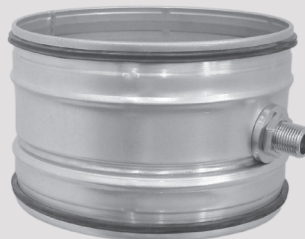
Kondensato mova NIDA d200-d125