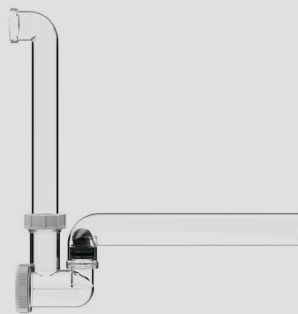
Kondensato sifonas HL136T DN32/40