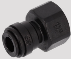
Adapteris osmosiniam filtrui 8x3/8