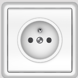
Kištukinis lizdas su žeminimo strypeliu, su rėmeliu ST150