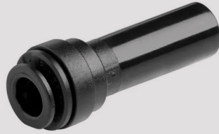
Redukcija 8-4 mm