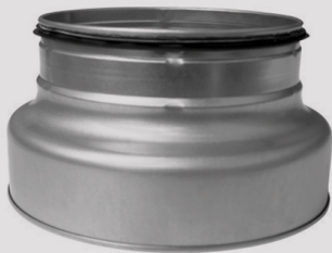
Periega d315,250,200 - d250, 200,160,125