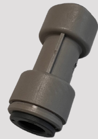
Redukcinė mova 5/16-1/4